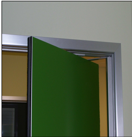
Particolare sistema apertura porta

Si ricorda che nel caso in cui siano installati maniglioni antipanico, questi devono essere montati a un'altezza che va da cm 90 a cm 110 dal livello del pavimento finito . Nel caso in cui sia noto che la maggior parte degli occupanti è rappresentata da bambini, per esempio scuola materna, si dovrà considerare una corretta riduzione dell'altezza del maniglione.